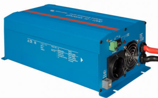
Phoenix Inverter 12/800 with Schuko socket