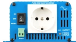
Phoenix Inverter 12/180 with Schuko socket