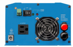
Phoenix Inverter 12/800 with Nema 5-15R socket