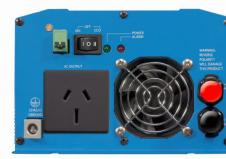
Phoenix Inverter 12/800 with AN/NZS 3112 socket