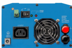
Phoenix Inverter 12/800 with IEC-320 socket