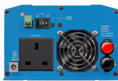
Phoenix Inverter 12/800 with BS 1363 socket