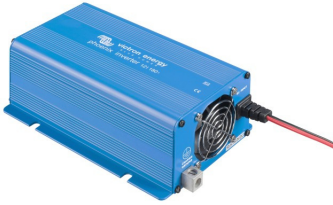
Phoenix Inverter 12/180