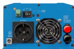
Phoenix Inverter 12/800 with Schuko socket